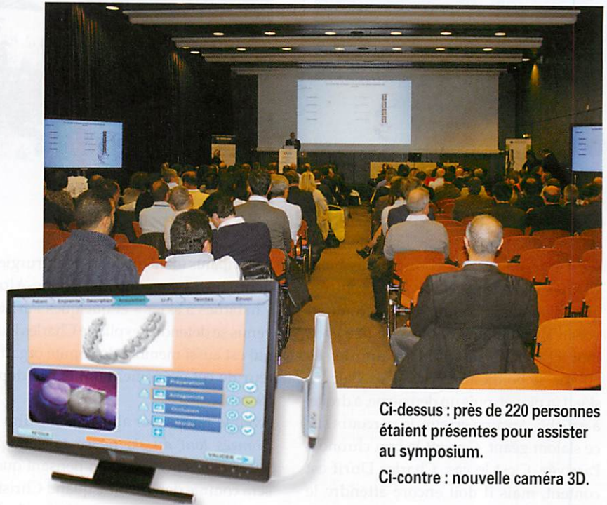
Ci-dessus : près de 220 personnes étaient présentes pour assister au symposium.