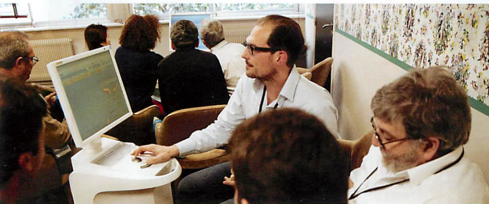
L'atelier « Découverte CFAO ».