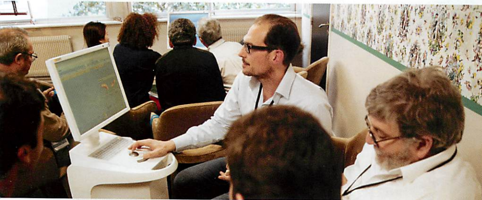
L'atelier « Découverte CFAO ».