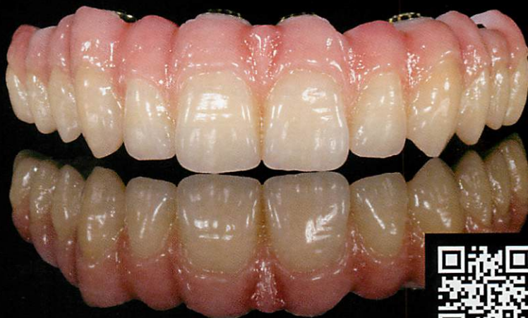
Bridge Prettau® avec barre en titane sur 6 implants