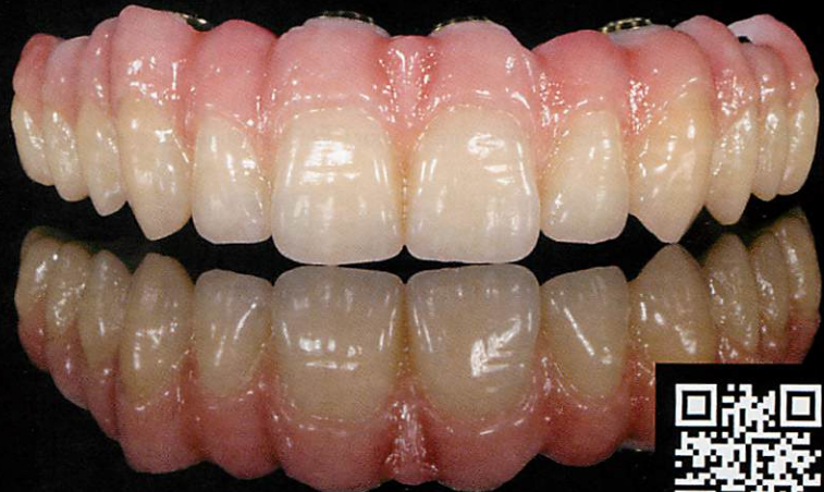
Bridge Prettau® avec barre en titane sur 6 implants